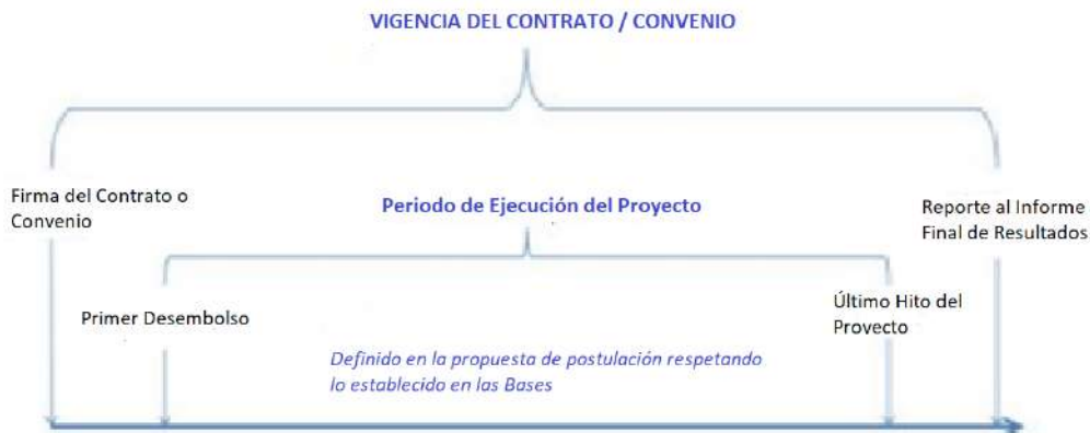
Figura 1. Vigencia y Periodo de Ejecución